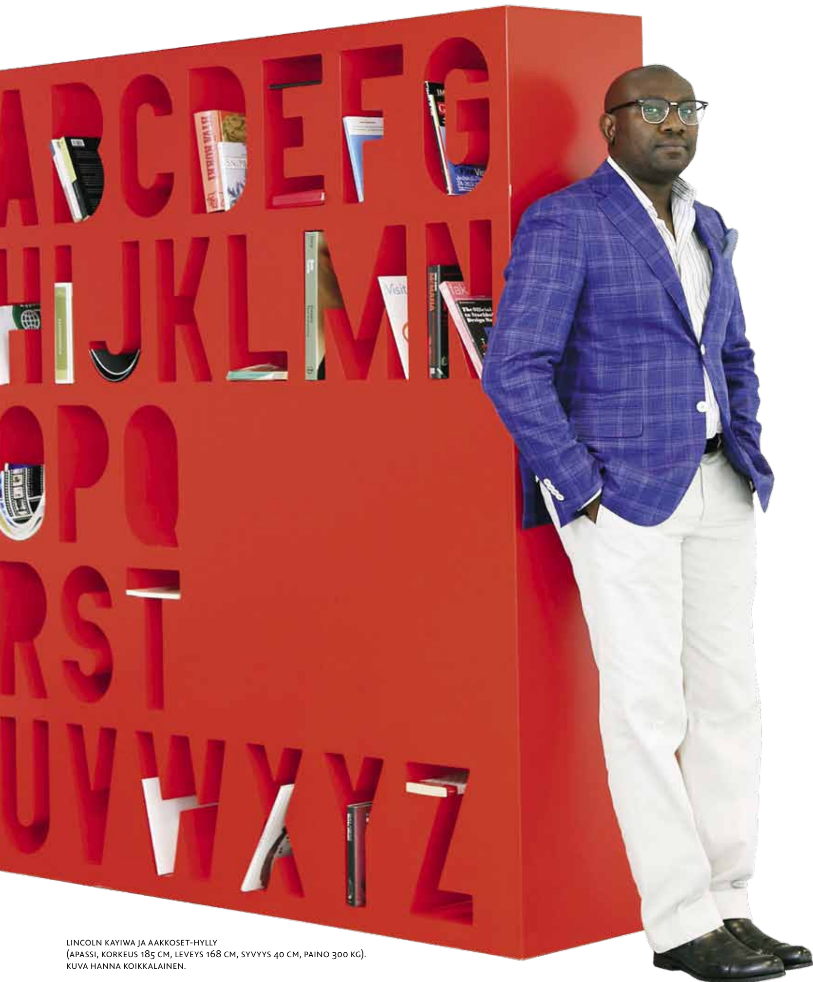
LINCOLN KAYIWA JA AAKKOSET-HYLLY (APASSI, KORKEUS 185 CM, LEVEYS 168 CM, SYVYYS 40 CM, PAINO 300 KG).