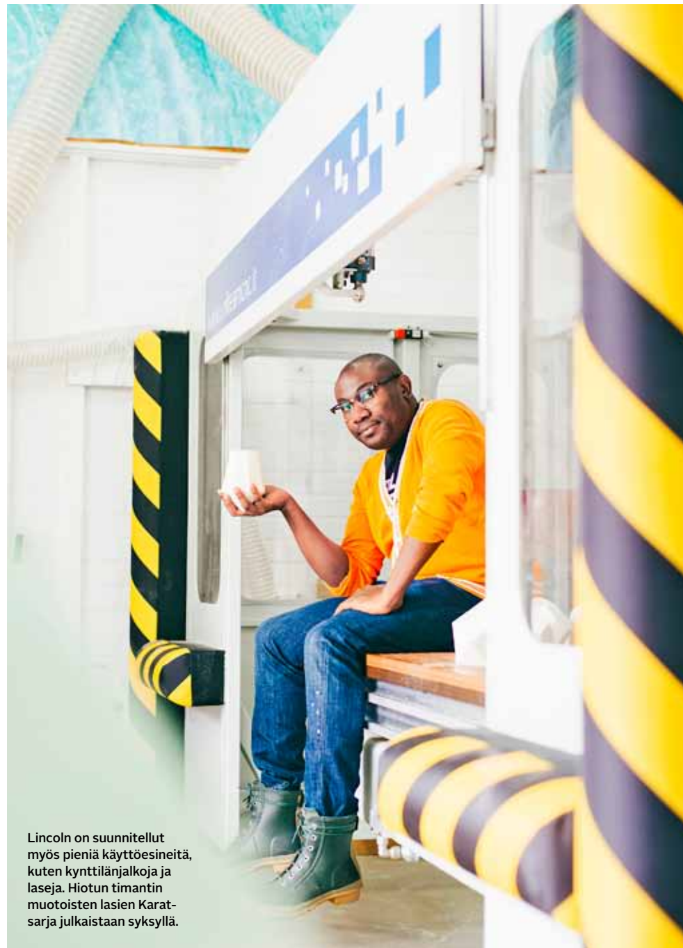
Lincoln on suunnitellut myös pieniä käyttöesineitä, kuten kynttilänjalvoja ja laseja. Hiotun timantin muotoisten lasien Karatsarja julkaistaan syksyllä.

keittiössä. Lincolnin bravuuri on häränhätä-muhennos, jota hän jaksaa haudutella padassa pitkään.