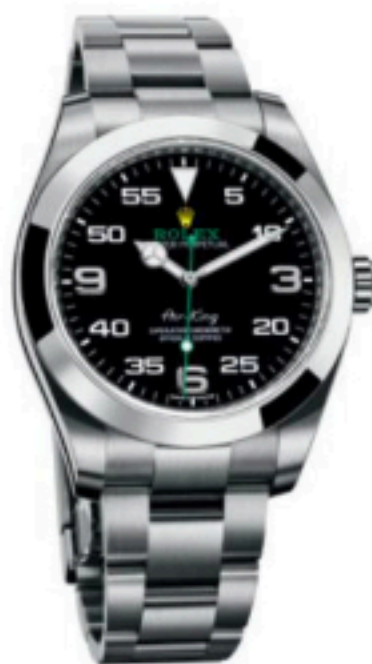
7500 € rolex.fr