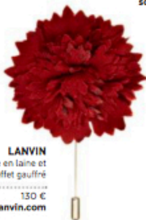
LANVIN Épingle à cravate en laine et soie effet gaufré ..... 130 € lanvin.com