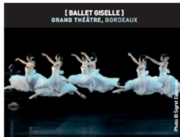
[ BALLET GISELLE ] GRAND THÉÂTRE, BORDEAUX

Enfilez smoking et robe longue pour un rendez-vous romantique et aérien avec Giselle. Il fallait bien deux L à Giselle pour qu'elle s'envole vers l'au-delà trouver l'amour éternel ! Tous les ingrédients du romantisme sont réunis pour faire de ce ballet un chef d'œuvre aux thèmes universels : Giselle éperdument amoureuse, Albrecht prince mélancolique déjà fiancé, un amour impossible. Chorégraphie de Charles Jude.