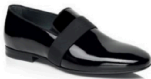
BALLY Mocassin vernis en cuir noir et ruban en gros grain ..... 425 € bally.fr