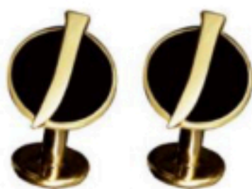
JAUBALET Boutons de manchettes en or 18 carats et laque ..... 1312 € jaubalet-paris.fr