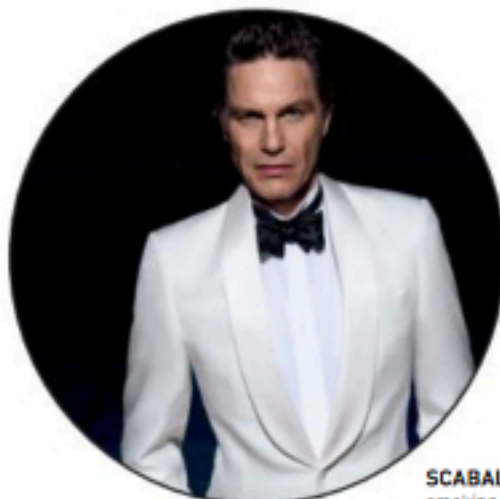
SCABAL smoking blanc en soie, modèle festival ..... prix sur demande scabal.com