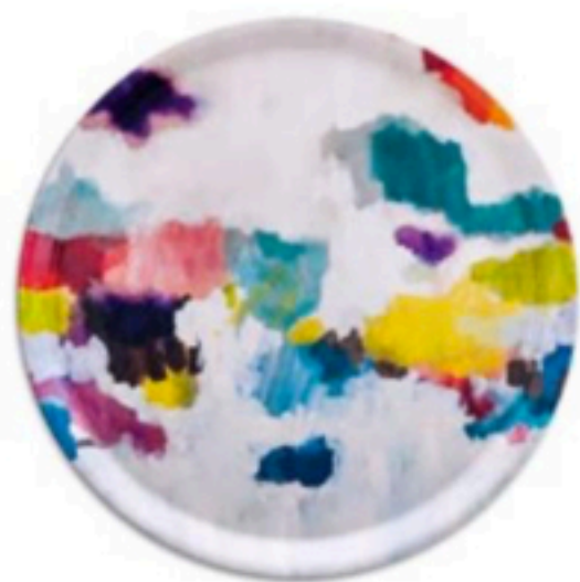
Podnos Nevis III, 29 €, www.westwing.sk